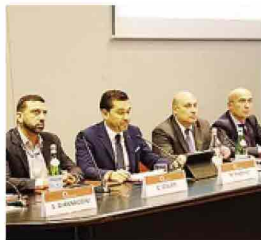
I partecipanti al convegno

Sarà colpa della crisi - la sottoscrizione di questi contratti ha avuto un'impennata a parti-